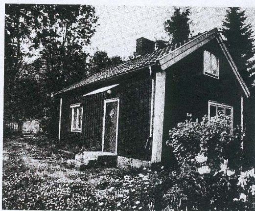
Grenadjärstorpet Sand 1988. Friköptes och blev eget småbruk 1909. Torpet kunde föda två kor och gris, på åkerlapparna odlades säd och potatis